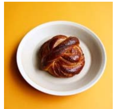
カルダモンロール